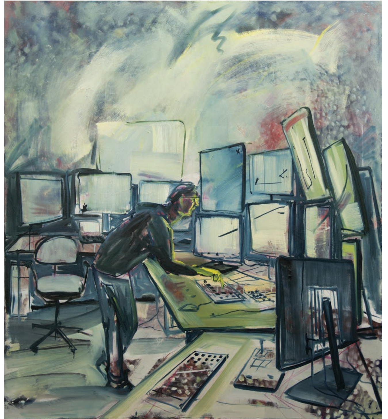
AUF KNOPFDRUCK (CLOUD) Öl auf Leinwand / 190 x 170 cm / 2016 AT THE PUSH OF A BUTTON (CLOUD) oil on canvas / 190 x 170 cm / 2016