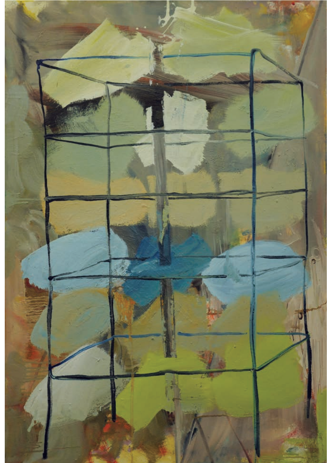
FREIRAUM Öl auf Leinwand / 100 x 70 cm / 2015 FREE SPACE oil on canvas / 100 x 70 cm / 2015