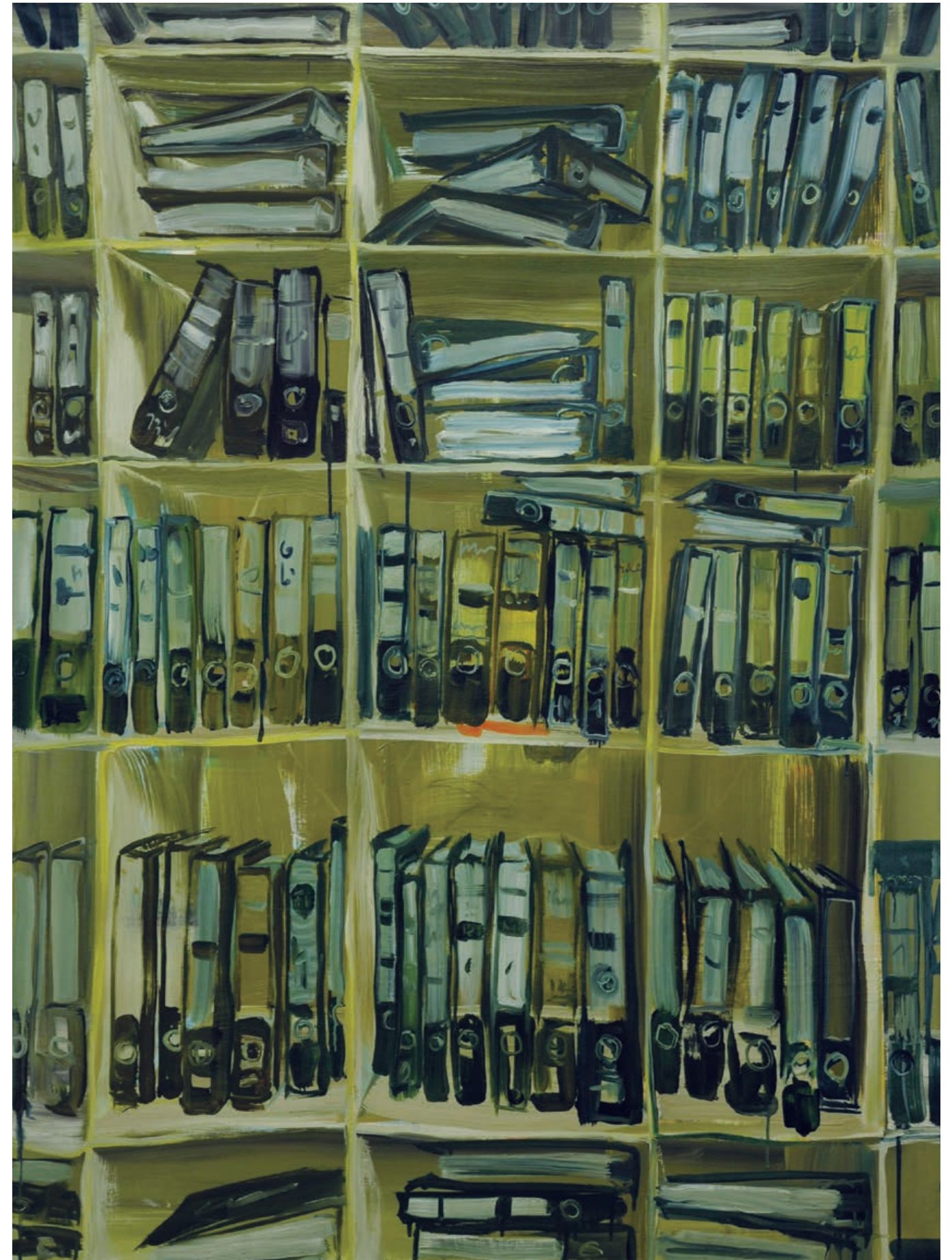
GELTENDES RECHT Öl auf Leinwand / 120 x 90 cm / 2016 APPLICABLE LAW oil on canvas / 120 x 90 cm / 2016