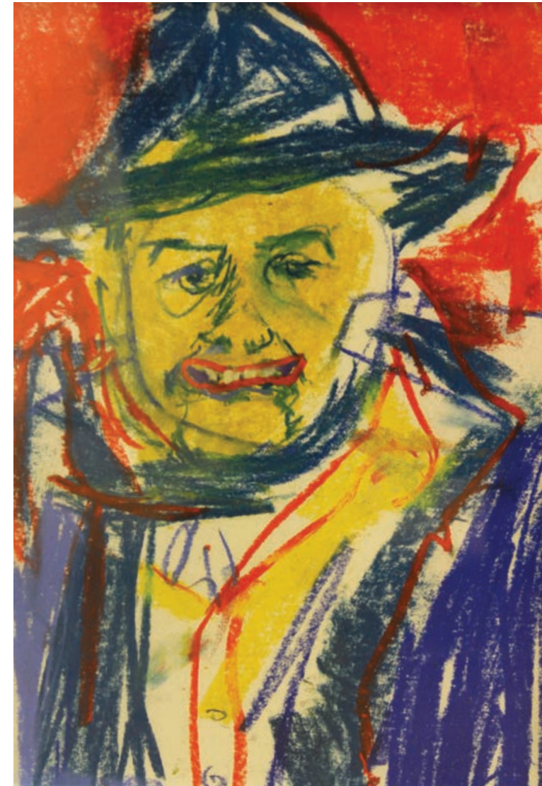
SZENE ZUM ESSEN Pastellkreide auf Papier / 29,5 x 21 cm / 2015 SCENE FOR THE MEAL pastel chalk on paper / 29,5 x 21 cm / 2015