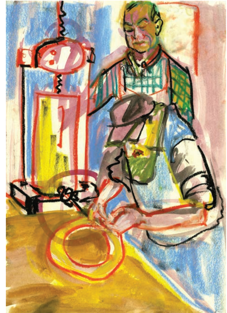
VOM SCHWEIN ZUR WURST Aquarell und Pastell auf Papier / 42 x 29,5 cm / 2015 FROM THE PIG TO THE SAUSAGE water colour and pastel on paper / 42 x 29,5 cm / 2015