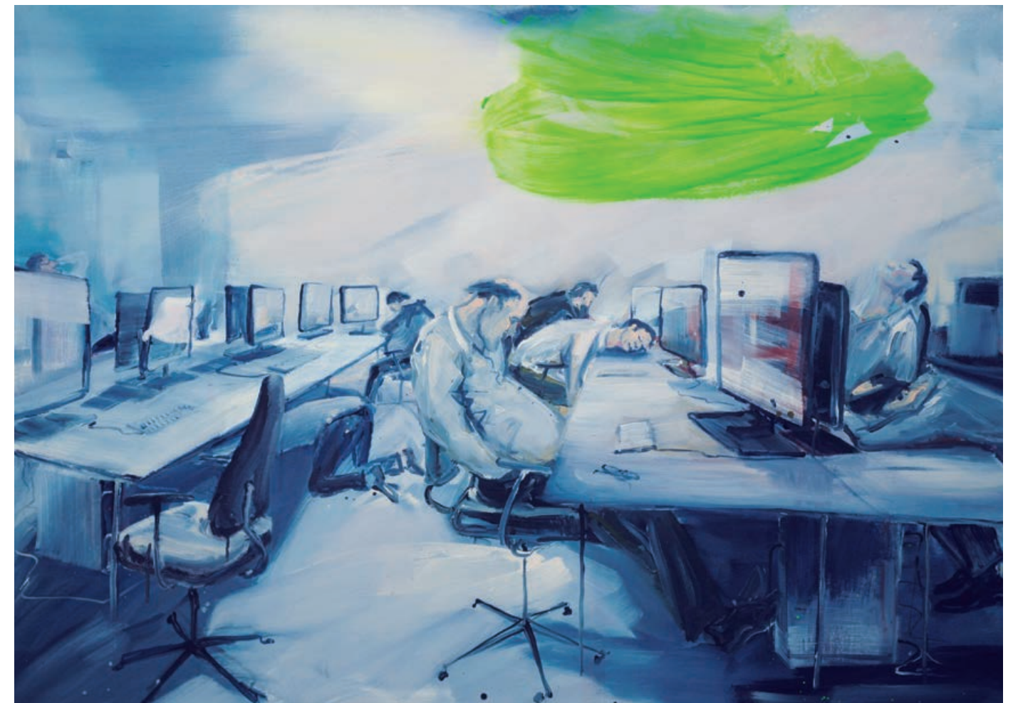
STROMAUSFALL Acryl auf Leinwand / 100 x 140 cm / 2016 BLACKOUT acrylic on canvas / 100 x 140 cm / 2016