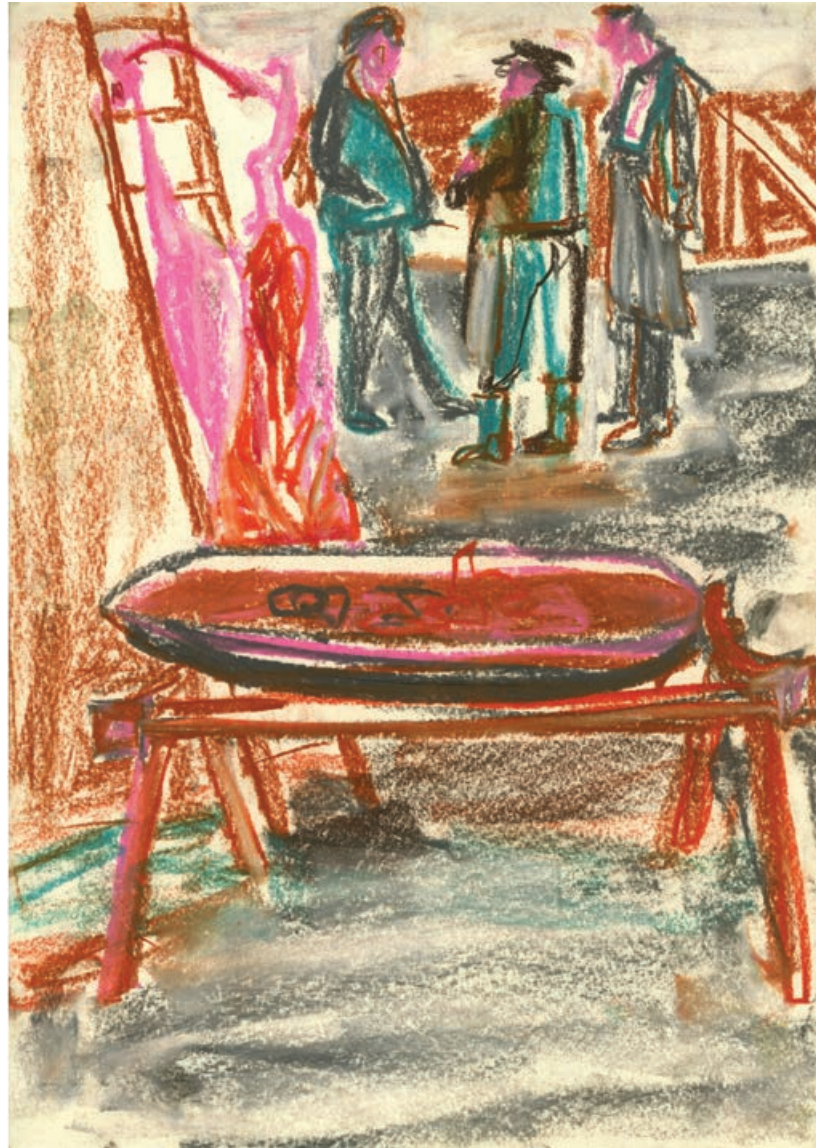
SCHWEINESCHLACHTUNG II Pastellkreide auf Papier / 42 x 29,5 cm / 2015 PIG SLAUGHTER II pastel chalk on paper / 42 x 29,5 cm / 2015