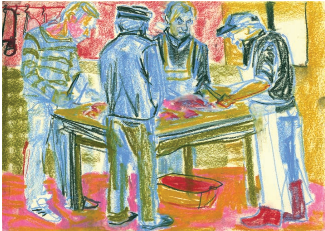
SCHWEINESCHLACHTUNG III Pastellkreide auf Papier / 42 x 29,5 cm / 2015 PIG SLAUGHTER III pastel chalk on paper / 42 x 29,5 cm / 2015